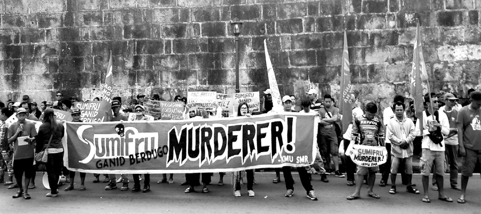
KILOS-PROTESTA NG MGA MANGGAGAWA NG SUMIFRU SA DOLE-CENTRAL OFFICE INTRAMUROS, LARAWAN NI BERNI RAMOS DISYEMBRE 2018