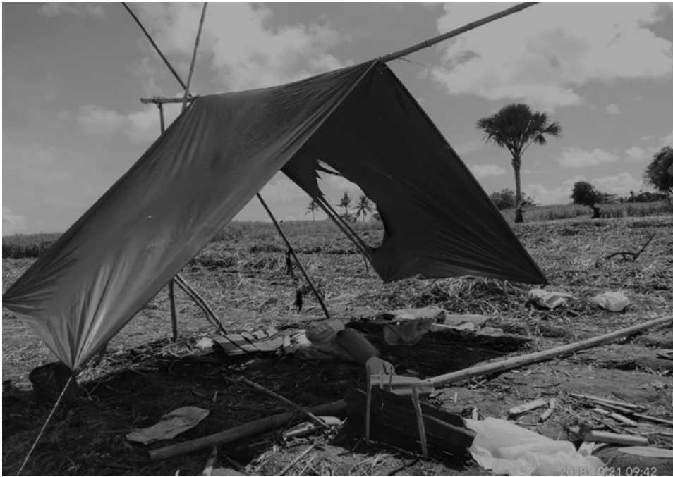
KUBOL NG MGA MINASAKER NA MANGGAGAWANG BUKID SA NEGROS, OKTUBRE 2018