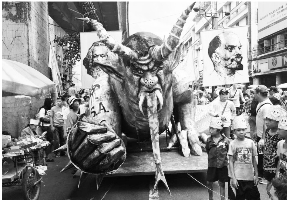
DU30MONYO, effigy ng Kilusang Mayo Uno sa araw ng paggawa

Noong March 16, 2017, si Labor Secretary Silvestre Bello ay nag-isyu ng DO No. 174. Ang Department Order na ito ay hindi nagpapawalang-bisa sa kontraktwalisasyon bagkus