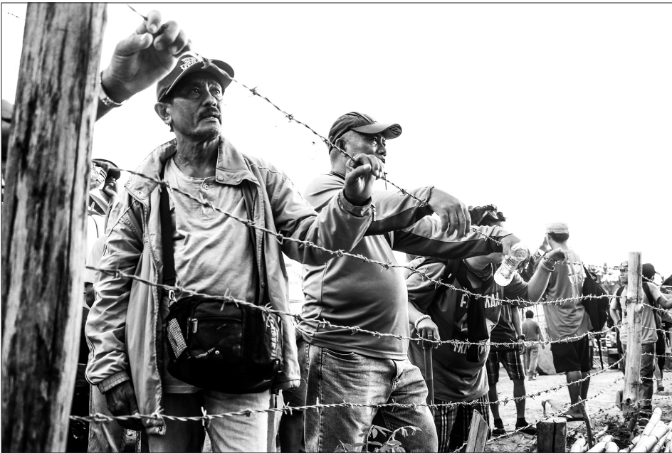
Matagumpay na inokupa ng mga myembro ng Madaum Agrarian Reform Beneficiaries Association, Inc. o MARBAI sa Tagum City ang 145-ektaryang lupang kinakamkam ng Lapanday Corporation nitong Mayo 18.