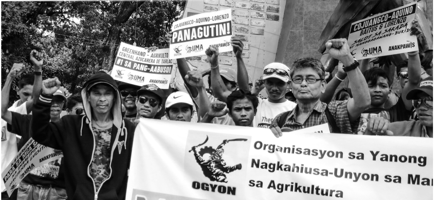
KILOS-PROTESTA NG MGA SAKADA AT OGYON-UMA SA CAGAYAN DE ORO CITY, ENERO 2017