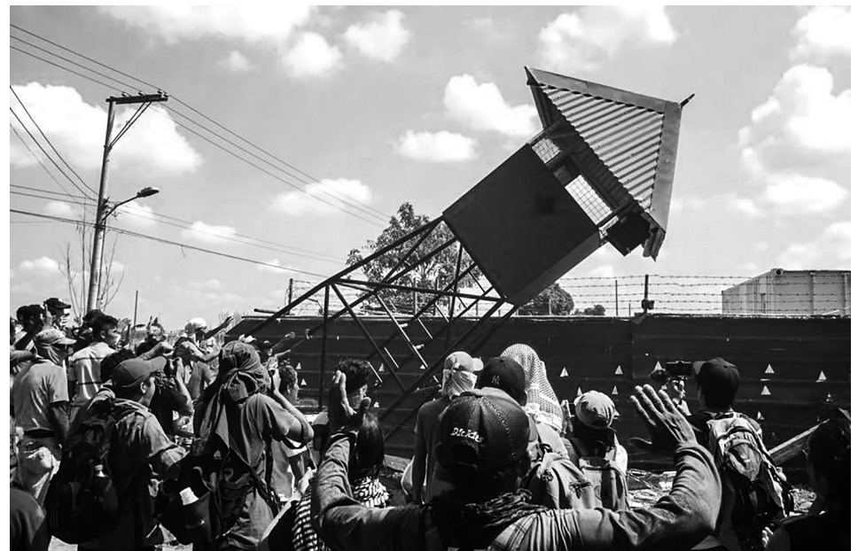
PYUDALISMO, IBAGSAK! LARAWAN MULA SA HACIENDA LUISITA, ABRIL 24, 2017

Okupahin at bungkalin ang mga hacienda at plantasyon!